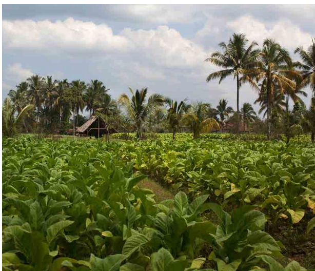
Spoločnosť Philip Morris bola ocenená za environmentálne snahy v spolupráci s dodávateľmi.

Spoločnosť Philip Morris International dosiahla za svoje snahy a spoluprácu s dodávateľmi pri znižovaní emisií a rizík súvisiacich so zmenou klímy vo svojom dodávateľskom reťazci popredné umiestnenie v celosvetovom rebríčku CDP – Supplier Engagement Leader. Philip Morris je jednou z 58 spoločností, ktoré v rebríčku dosiahli index A. Predstavuje to umiestnenie medzi top 2% z viac ako 3 300 spoločností, ktoré v roku 2017 CDP hodnotila za ich stratégie spolupráce v dodávateľskom reťazci.