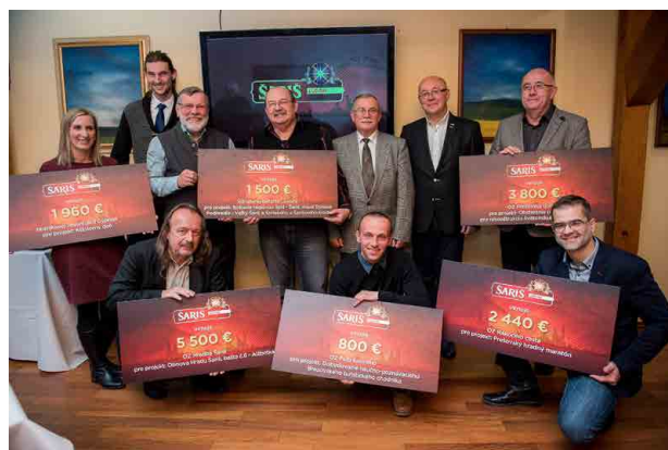
Vitážne projekty programu „Šariš ľuďom“ opäť prispievajú k zatraktívneniu prešovského regiónu.

Do programu sa prihlásilo 20 neziskových organizácií. Finančnú podporu v celkovej hodnote 16 000 eur dostalo 6 z nich. Vďaka podpore sa spoja regióny Spiš a Šariš turistickou trasou, bude dobudovaný náučno-poznávací Brezovský turistický chodník a obnoví sa cesta na hrad Šariš a tiež časť samotného hradu. Na jeseň sa uskutoční Kláštorň deň, ktorý pripomenie život kartuziánskych a kamaldulských mníchov. Počas leta sa spustí Prešovský hradný maratón, ktorého cieľom je propagovať a navštíviť čo najväčší počet obnovovaných hradov v Prešovskom kraji. Naplánovaná je aj výmena píšťal jedného z 35 organových registrov v kostole Svätého Mikuláša v Prešove a región tým získa koncertný nástroj európskej úrovne.