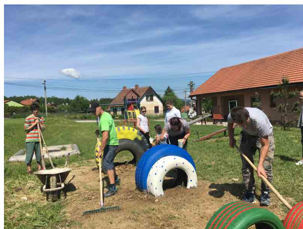
Zamestnanci VÚB banky skrášľujú svoje okolie vo všetkých kútoch Slovenska.