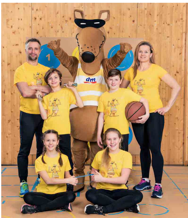
Cieľom projektu Lahšie to ide ľahšie je motivovať deti k cvičeniu.