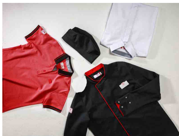
Kaufland oblieka zamestnancov do biobavlny a šetrí tak životné prostredie.

Pri biobavlně s certifikátom GOTS sa naopak znižuje celková spotreba vody až o 71% a táto bavlna neobsahuje žiadne škodlivé látky. Fairtrade certifikát je tiež zárukou, že bavlna sa vyrobila za sociálne a ekonomicky vhodných podmienok.